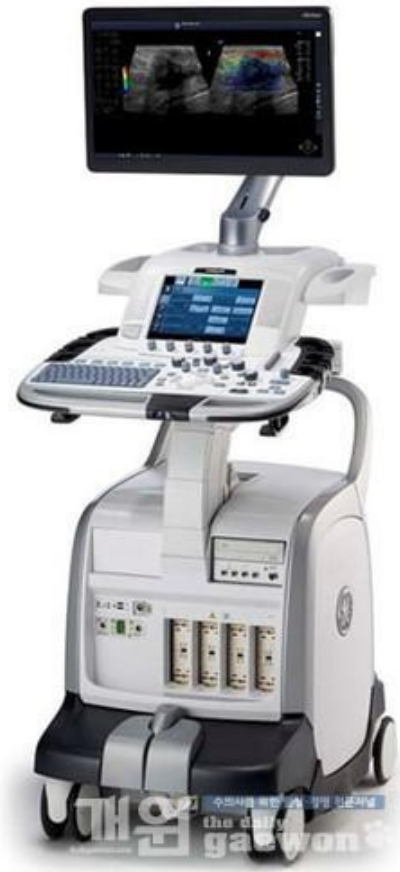
LOGIQ E9(XD Clear2.0)